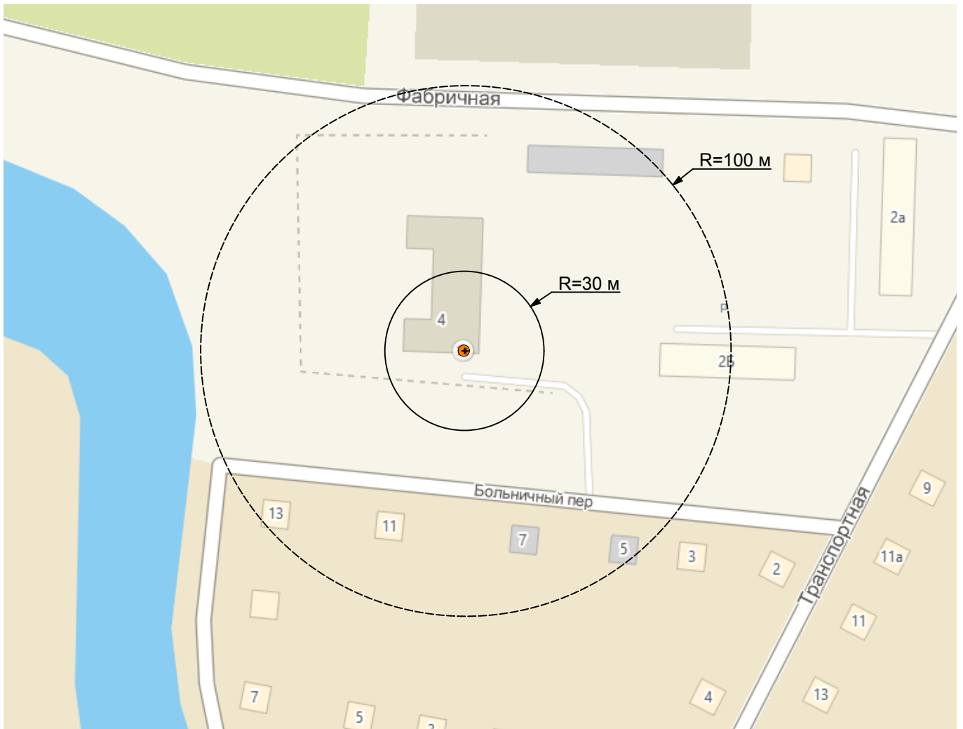
Схема границ прилегающих территорий М 1:2000